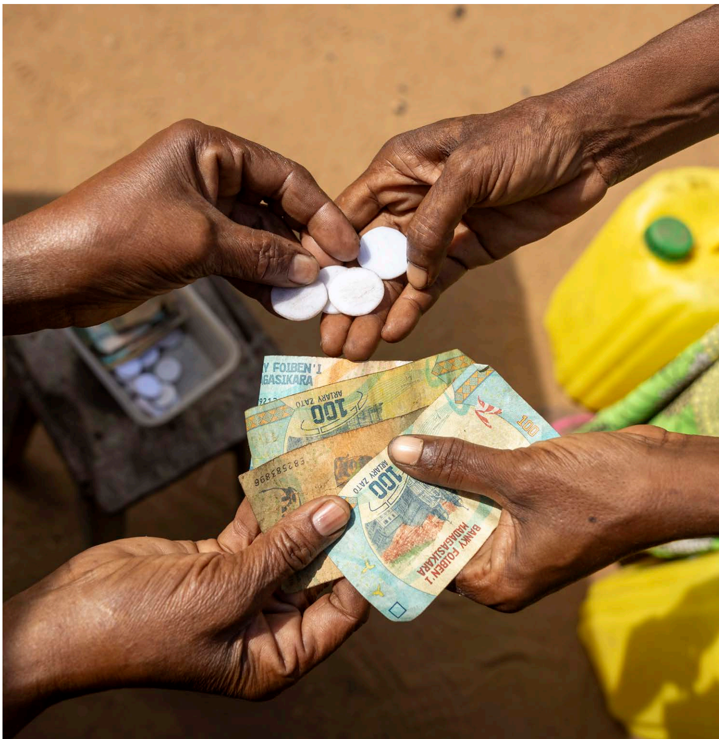
Échange de billets et de monnaie à Madagascar